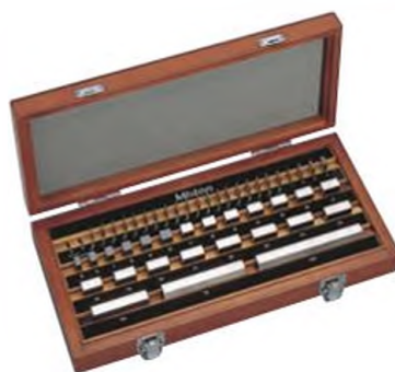
Набор КМД из 47 шт.