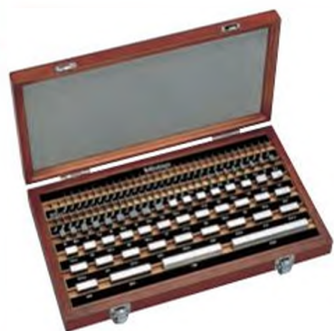
Набор КМД из 112 шт.