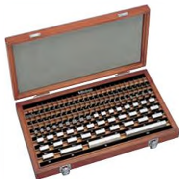
Набор КМД из 103 шт.